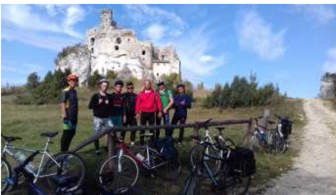
Rowerowa ekipa na tle jednego z zamków na Szlaku Orlich Gniazd (Mirów)