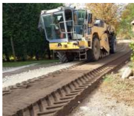
Rewitalizowana droga gminna w Rudach (Paproć)