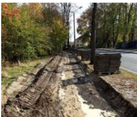
Chodnik przy ul. Topolowej podczas prac remontowych

Mowa o chodniku znajdującym się po prawej stronie wzdłuż ul. Topolowej w Kuźni Raciborskiej. Niebawem ma zostać również rozstrzygnięty przetarg na remont ciągu pieszego znajdującego się po lewej stronie tej drogi.