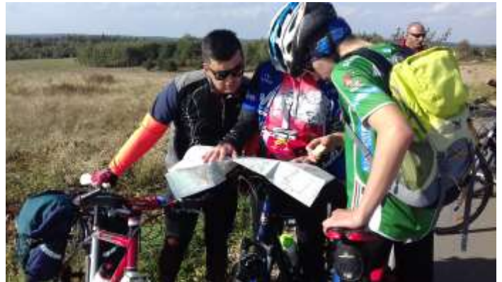
Przerwa w podróży. Od czasu do czasu trzeba spojrzeć w mapę