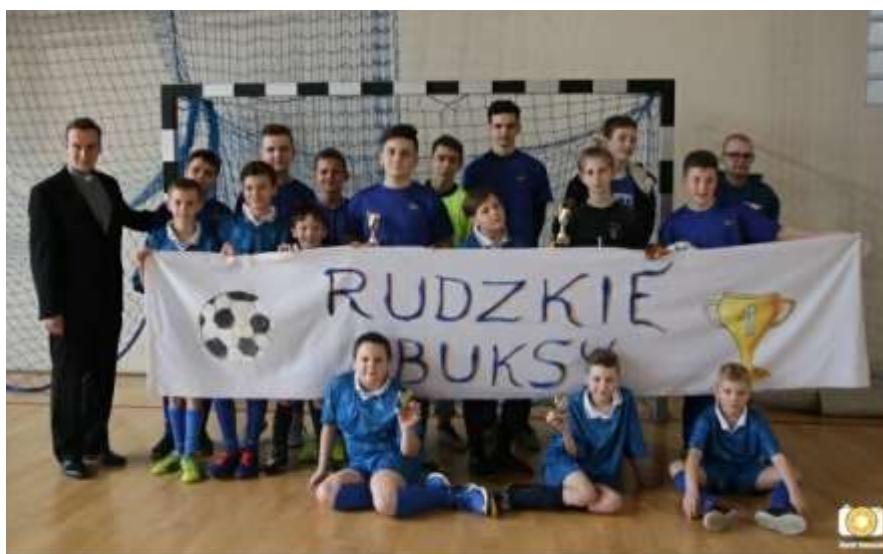
UM Kuźnia Raciborska, oprac. BK, fot. Marek Tomasiak

Dziergowice - Kuźnia Raciborska 2:1 Rudy - Babice 3:0 Dziergowice - Rudy 0:0 Kuźnia Raciborska - Babice 1:3 Dziergowice - Babice 1:0 Rudy - Kuźnia Raciborska 3:0