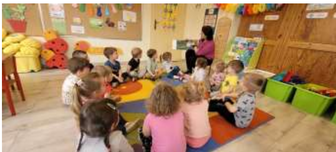
Kasia Machecka Biblioteka Rudy

Wspaniale rozwija się współpraca pomiędzy rudzkim przedszkolem i biblioteką, dlatego 11 kwietnia ponownie zagościliśmy w przedszkolu, tym razem miałyśmy przyjemność poznać grupę Biedronki. Przedszkolaki podzieliły się swoją wiedzą na temat biblioteki oraz tego, co w niej można robić. Następnie wspólnie przeczytaliśmy krótką bajeczkę, pokłosem czego było wykonanie przez dzieci pamiątkowej pracy plastycznej. Dziękujemy za zaproszenie a dzieci wraz z rodzicami serdecznie zapraszamy do rudzkiej księżnicy.